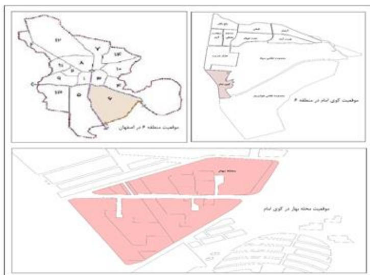
شکل ۲: موقعیت محله بهار

منطقه شش یکی از مناطق پانزده گانه‌ی شهرداری شهر اصفهان است که در جنوب شرقی شهر واقع شده است. منطقه شش شهر اصفهان شامل ۱۲ محله رسمی و اداری می‌باشد. محله بهار نیز یکی از این محلات است که در پهنه غربی منطقه شش واقع شده است. که از شمال با محله هزار جریب از شرق با محدوده نظامی سپاه از جنوب با محله امام و از غرب با محدوده دانشگاه اصفهان هم‌جوار است. (شکل ۲).